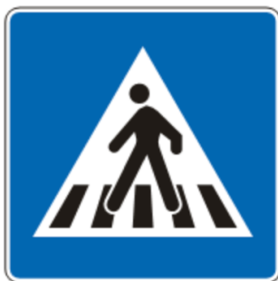
Znak: Pješački prelaz

Koristite pješačke prelaze: Uvijek prelazite ulicu na obilježenim mjestima.