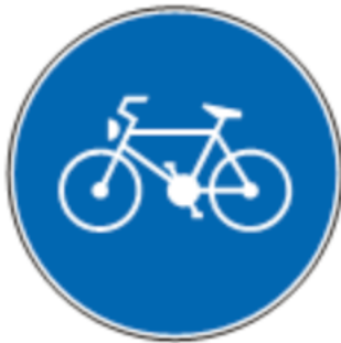
Znak za biciklističku stazu

Krećite se biciklističkim stazama: Ako one postoje.