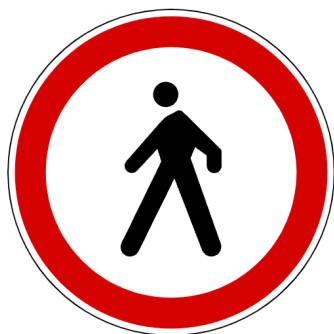
Znak zabrane pješaćenja

Obavještajni znakovi: Pružaju informacije o putu i okolini.