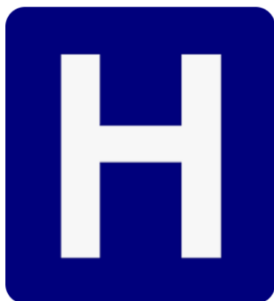
Znak „Bolnica u blizini“

Obavještajni znakovi: Pružaju informacije o putu i okolini.